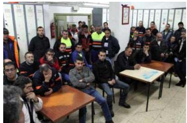
Los estibadores vigueses celebraron una asamblea en la mañana de ayer en la sede de la SEED.

L. PIÑERO - VIGO Los estibadores de Vigo, Marín y Vilagarcía comenzaron a primeras horas de hoy una huelga, en contra de la modificación de la Ley de Puertos, que, en principio, está prevista que dure hasta las 8 horas del próximo sábado. Sin embargo en las próximas horas la situación puede cambiar. A primeras horas de la tarde de ayer los representantes sindicales de la Sociedad Estatal de Estiba y Desestiba (SEED) mantuvieron una reunión con directivos de la Autoridad Portuaria y de las empresas estibadoras en la que acordaron elaborar un documento para evitar que la huelga se prolongue más días.