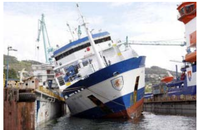
Imagen del barco escorado ayer en el astillero vigués.

J. CARNEIRO Dos tripulantes del oceanográfico Miguel Oliver cayeron ayer al mar y resultaron heridos al escorar el buque en un dique del astillero vigués Metalships. El accidente se produjo debido a una "mala maniobra" al subir el barco a un dique flotante para una reparación, según fuentes del astillero. Esto provocó una escora en el buque de treinta grados y que se precipitasen al agua los dos tripulantes: uno rompió una pierna y otro recibió un golpe en el pecho. Ambos fueron rescatados de inmediato y trasladados a un hospital vigués.