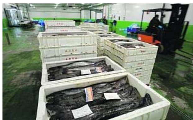
Cajas de pescadilla y merluza en la rula de Avilés